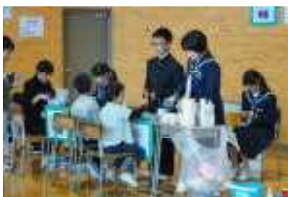
生徒会企画「スライム作り」