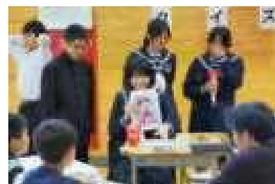
生徒会企画「クイズ」