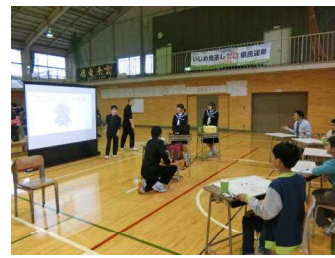
生徒会企画「お絵かき」