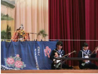
文弥人形「粟津ヶ原の戦い」

午後の生徒会企画は、生徒会で決めたスローガン「熱盛」のごとく、体育館は大いに盛り上がりました。文化祭は大成功で幕を閉じました。