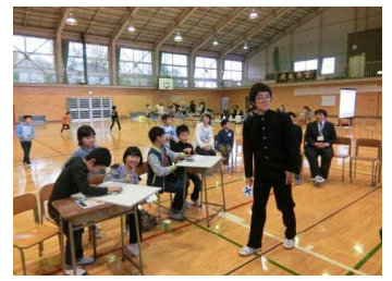
生徒会企画「クイズ」