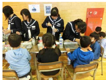
生徒会企画「スライム作り」