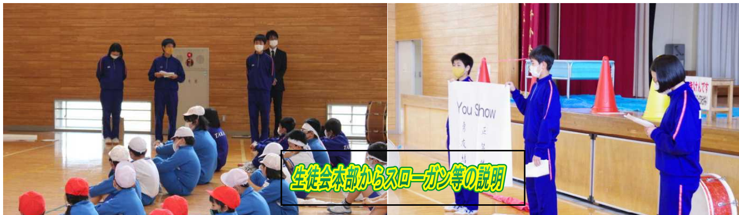
生徒会本部からスローガン等の説明