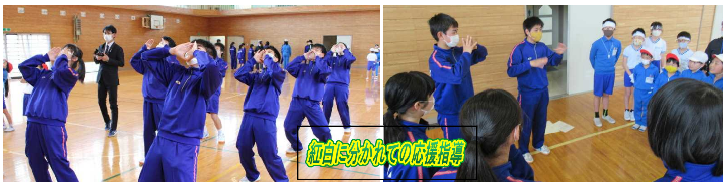
紅白に分かれての応援指導