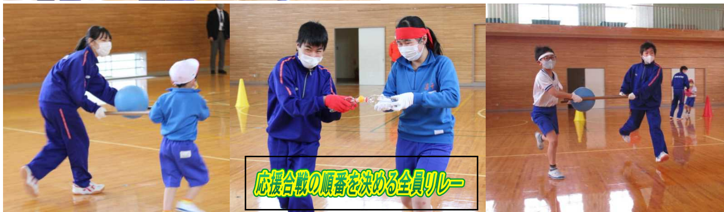
応援合戦の順番を決める全員リレー